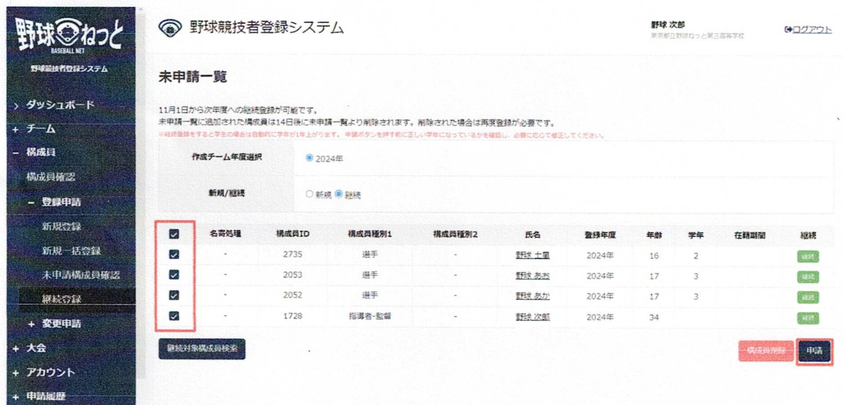
継続対象構成員一覧画面